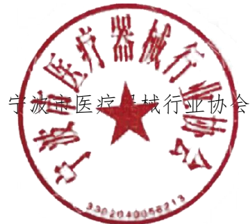
宁波市医疗器械行业协会