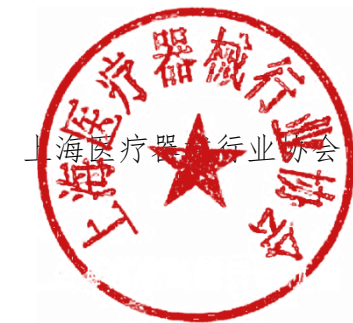
上海市医疗器械行业协会