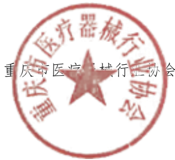
重庆市医疗器械行业协会