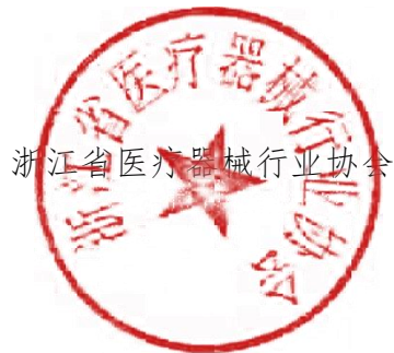
浙江省医疗器械行业协会