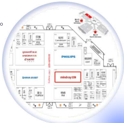
示意图（CMEF往届展位图）